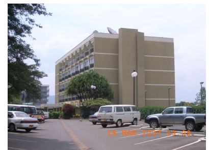
ミルコリンズ・ホテル Hotel des Mille Collines