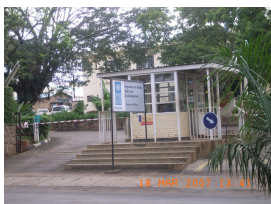
UNDP (仏名PNUD) UNDP or PNUD en Franaise

Although I have already worked for one month at UNDP, I am still trying to figure out what my job is. I belong to the Sustainable Livelihood Unit, and the unit chief is vacant from the beginning of this year. Thus, I do not have a colleague from whom I can expect basic instructions. To make the situation worse, the unit chief a.i. is leaving our office at the end of April. But still, the working environment is relatively good and my colleagues are very friendly and helpful. Currently, I share my office space with a Swedish woman and she helps me a lot, too. The fact that the office hour starts at eight a.m. is very harsh to me, but I am trying to understand the status quo of Rwanda slowly by visiting offices of the Government of Rwanda relating to my tasks. The main tasks are: 1) Recovery and recycle of CFC under Montreal Protocol; 2) Climate change adaptation; 3) Proposal of energy projects specifically on microhydro.