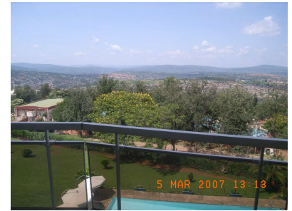
ミルコリンズからの眺め View from the Mille Collines

I finally arrived in Kigali, capital city of Rwanda, on March 5 th . Before the arrival, I had a chance of joining UNDP training in Denmark and also stayed in Nairobi for two nights. In Nairobi, my only impression was that 'this is a scary city' and 'I have to be really careful' as the information I received was such that foreigners can't walk on streets and that the car jacking happens very frequently. On the other hand, the first impression of Rwanda was that 'How beautiful the city is!' and that 'Does this beautiful country really need international aids for their development?'. For the first few days, I suffered from sunstroke under strong sunshine. But, I could realized in a few days that the slight headache was caused by sunstroke, then, I could prevent the further headache properly. For the first two weeks, I stayed at Hotel des Mille Collines, which became famous by the movie 'Hotel Rwanda'.