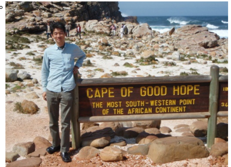
Cape of Good Hope / 喜望峰