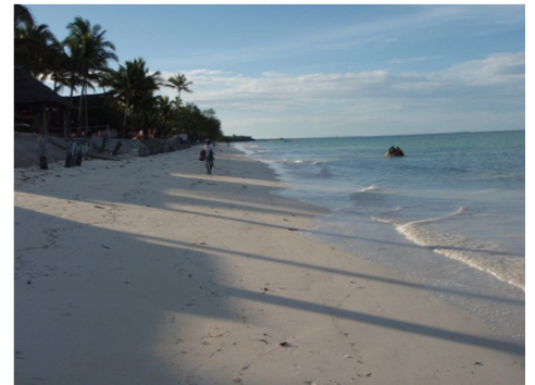
White beach in Zanzibar / ザンジバルの白い砂浜