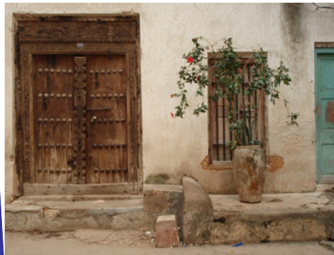
Stone Town is famous for wooden doors / ストーン・タウンは木製の扉が有名