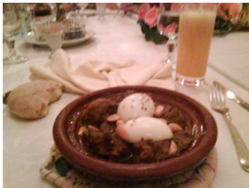
Tajin dish in Casablanca / カサブランカのタジン料理