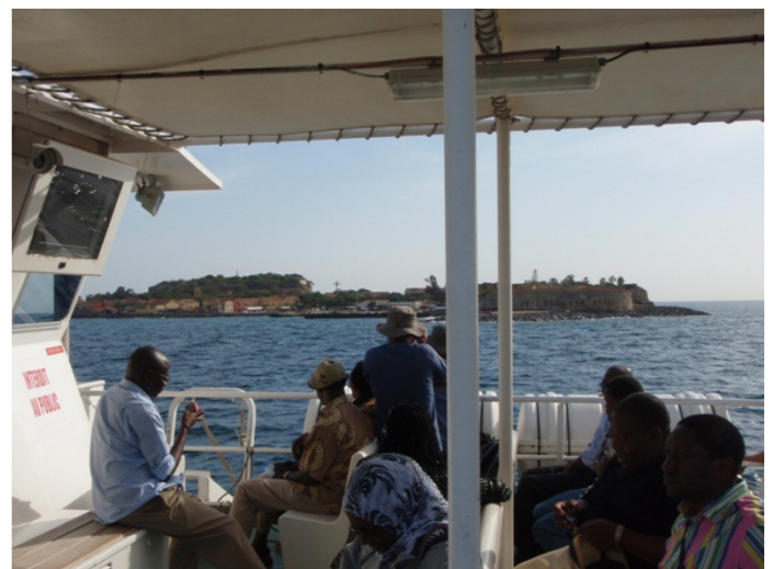
Ile de Goree in Dakar: world heritage site and this island was a shipping point of African slaves. The cannon in the left was installed by France during the World War II / ダカールのゴレ島：世界遺産であり、島は昔はアフリカ奴隷を送り出す場所だった。左の大砲は第2次大戦時にフランスが設置