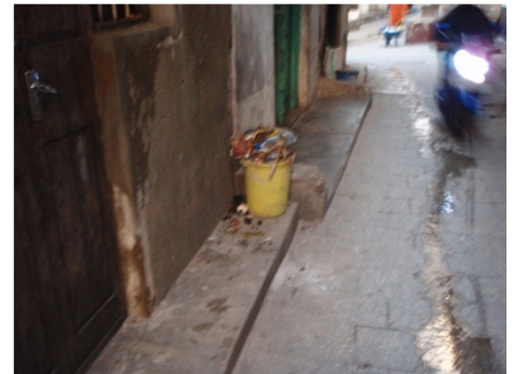
Stone town: Garbage is put in front of each house for collection / ストーン・タウン：ゴミは各家の前で収集を待つ