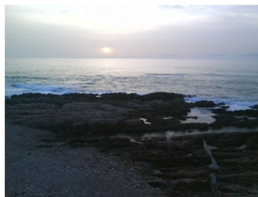
Sunset in the Atlantic Ocean (left) and a mosque (down) in Casablanca / カサブランカでの大西洋への日没（左）とモスク（下）